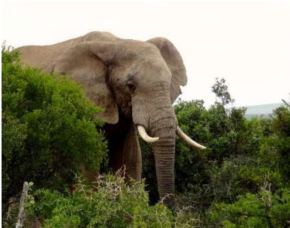
(Photographies non contractuelles)

Le transfert en car Aller/Retour entre Saint-Maur et l'aéroport Charles De Gaulle avec lieux de rendez-vous, place des Marronniers et place de la Mairie.